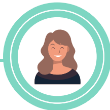
Réferente territoire : Saint-Brieuc Armor Agglomération