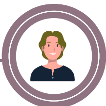
Conseiller numérique France Services