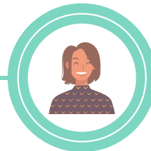
Réferente territoire : Lamballe Terre & Mer