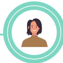
Réferente territoire : Guingamp-Paimpol Agglomération et Leff Armor Communauté