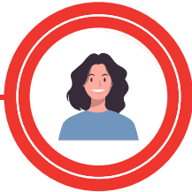
Coordinatrice de projets