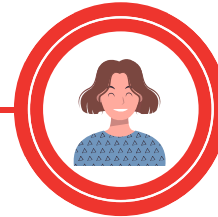
Chargée d'accueil et de logistique