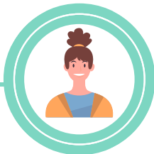
Réferente territoire : Lannion-Trégor Communauté et Communauté de Communes de Kreiz Breizh