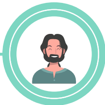
Réferent territoire : Dinan Agglomération