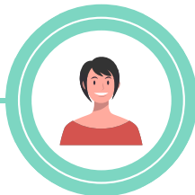
Réferente territoire : Loudéac Communauté Bretagne Centre