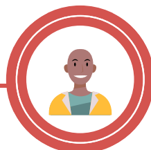
Médiateur emploi Quartier Prioritaire Saint-Brieuc Armor Agglomération